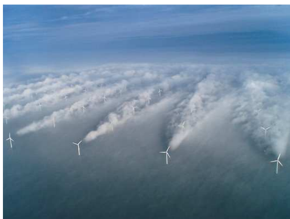
Photographie du sillage d'éoliennes offshore.